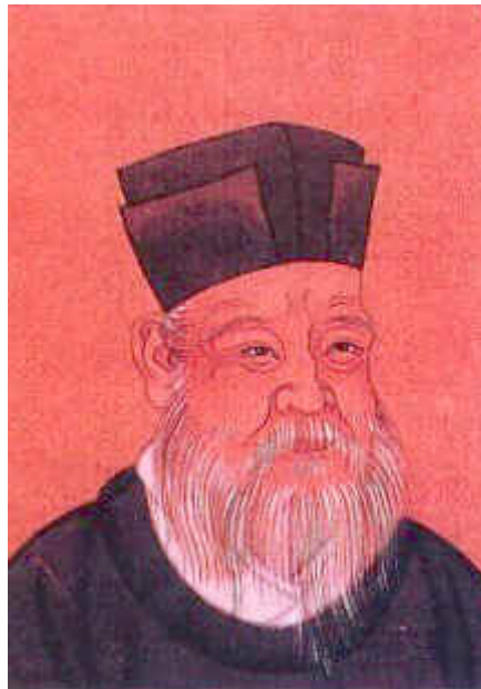
Zhu Xi (1130-1200)

Colloque international Organisé par l'Institut d'Asie orientale, l'Université Diderot Paris 7 et l'Association Recherche et Enseignement de Chinois (AREC)